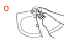
0 Намочіть руки водою