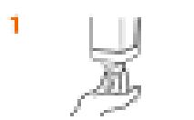
1 Намочіть обидві долоні, щоб вони повністю були вмиєні водою