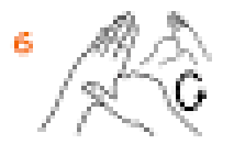
6 Потріть пальці однієї руки проти пальців іншої руки