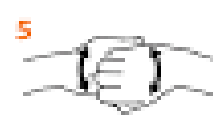
5 Зверніть увагу на простір між пальцями