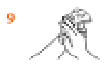
9 Потріть долоню однієї руки проти долонь іншої руки, звертаючи увагу на простір між пальцями