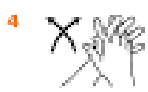
4 Потріть долоню однієї руки проти пальців іншої руки