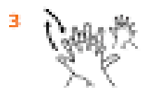
3 Потріть долоню однієї руки проти долонь іншої, звертаючи увагу на простір між пальцями і нігтьми