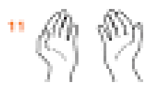
11 Трясіть водою руки в дилі