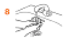
8 Зверніть увагу на простір між пальцями