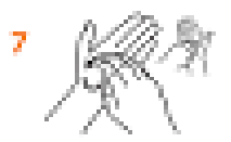
7 Потріть долоню однієї руки проти долонь іншої руки, звертаючи увагу на простір між пальцями