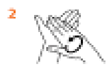
2 Масаруйте долоні однієї руки проти долонь іншої