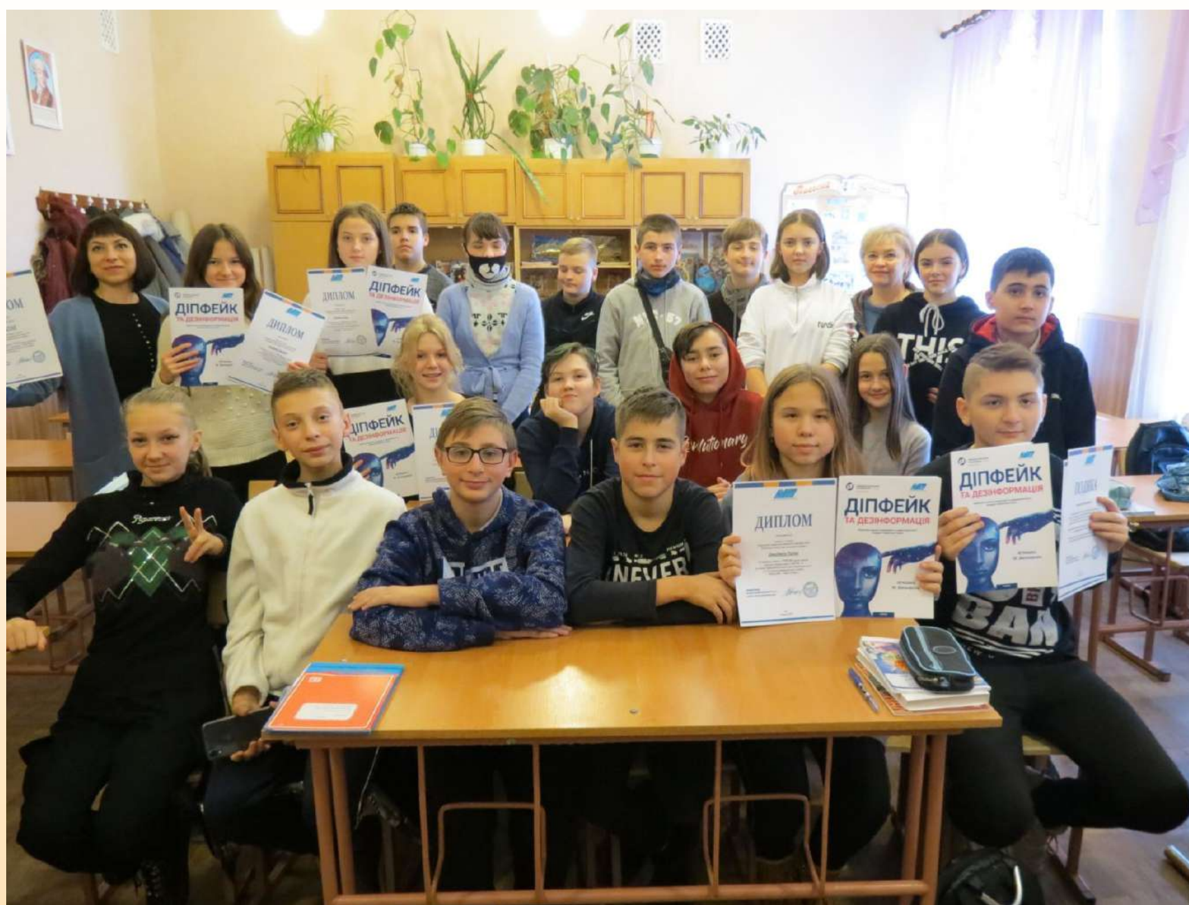
Автор: Карпенко Марія