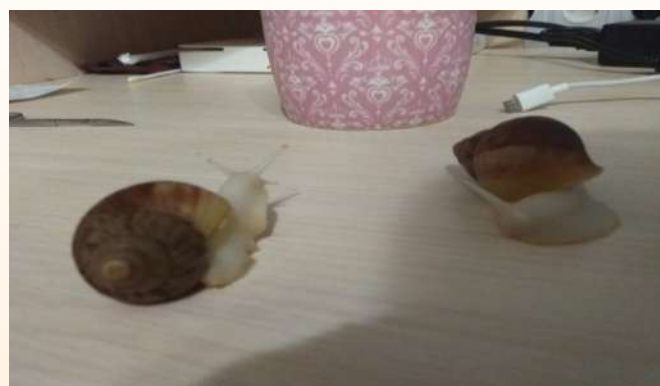
“2 моїх

Знає команди: сидіти, дай лапу, в якій руці, чекати, лежати.” - прокоментувала своє